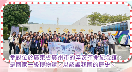
參觀位於廣東省廣州市的辛亥革命紀念館，是國家一級博物館，以認識我國的歷史。

本校全體老師於2025年1月2日乘坐高鐵到廣州進行內地科技及文化歷史探索之旅。此次教師發展日能有助同事擴展視野、提升個人的專業，並能加深對國內科技及文化歷史的認識。是次活動希望讓老師們親身體驗廣深港高鐵這項重要交通基建，嘗試透過一地兩檢及乘坐高鐵體驗大灣區一小時生活圈的概念，並透過參觀廣東科學中心及廣州辛亥革命紀念館，以及嘗試廣州地道食物，了解近代我國歷史、港穗兩地歷史文化聯繫及最新科技教育發展。