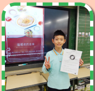
多元化學習任務匯報