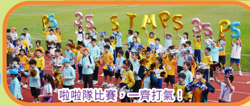
啦啦隊比賽，一齊打氣！