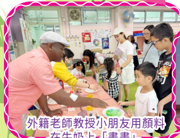
外籍老師教授小朋友用顏料 在牛奶上「畫畫」