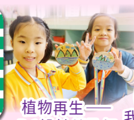
植物再生——P.1設計鎖匙扣