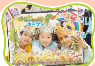
一年級100 th Day of School

本年度，學校在Shining+時段開展形式多樣的聯課活動，包括：週會、講座、多元化學習任務匯報、評估頒獎禮、學科延伸活動……讓學生有效運用學時，投入多元化及有意義的學習活動，延展所學，豐富學習經歷。