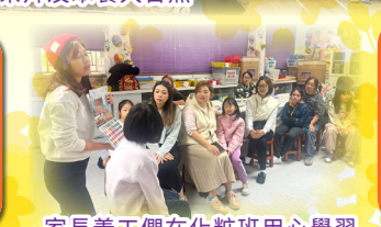
家長義工們在化粧班用心學習