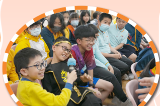
同學投入閱讀活動