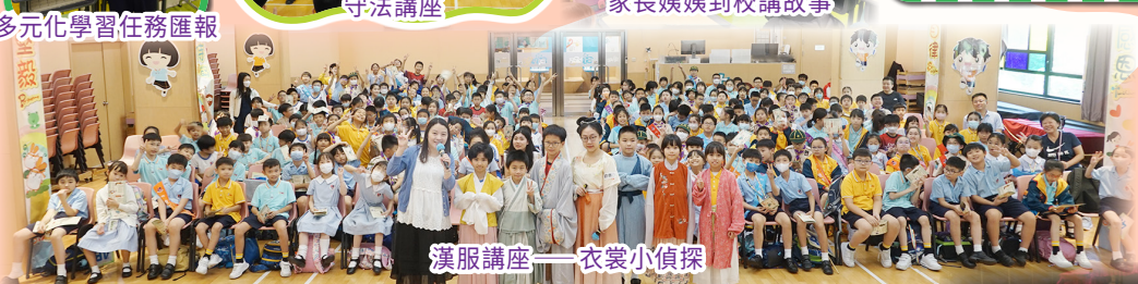
漢服講座——衣裳小偵探