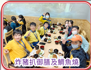
炸豬扒御膳及鯛魚燒