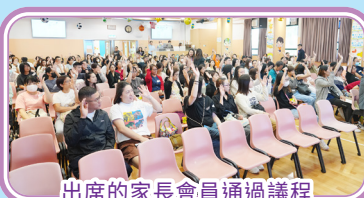
出席的家長會員通過議程