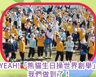
YEAH！「熊貓生日操世界創舉」我們做到了！