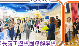
家長義工遊校園瞭解學校環境架設的理念