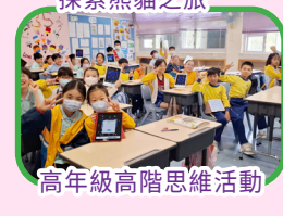
高年級高階思維活動