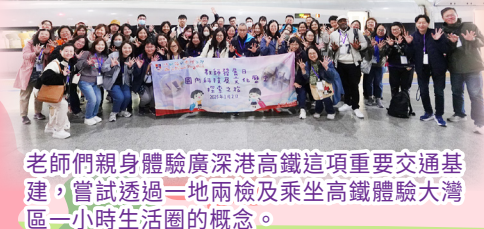
老師們親身體驗廣深港高鐵這項重要交通基建，嘗試透過一地兩檢及乘坐高鐵體驗大灣區一小時生活圈的概念。