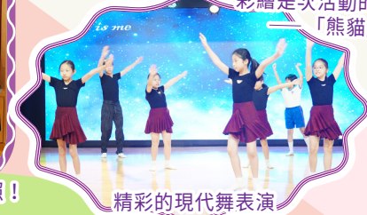
精彩的現代舞表演