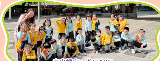
走出課室，遊環保徑