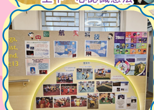
讓學生認識最新的國家發展