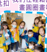
同心佈置，創意無限