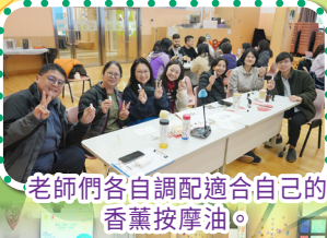
老師們各自調配適合自己的香薰按摩油。