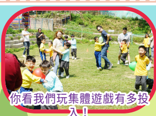
你看我們玩集體遊戲有多投入！