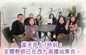
當天早上7時前，全體教師已在西九高鐵站集合。