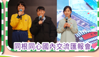
同根同心國內交流匯報會