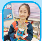
我愛沙循，你們看到我在機械人身上的microbit加上了「心心」嗎？