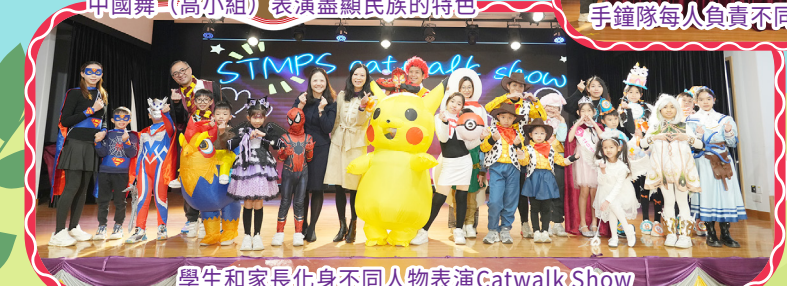
學生和家長化身不同人物表演Catwalk Show