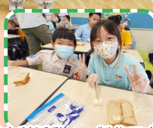
英文科活動——製作三文治