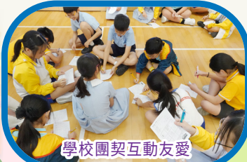
學校團契互動友愛