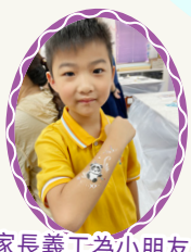
家長義工為小朋友 彩繪是次活動的主角 「熊貓」