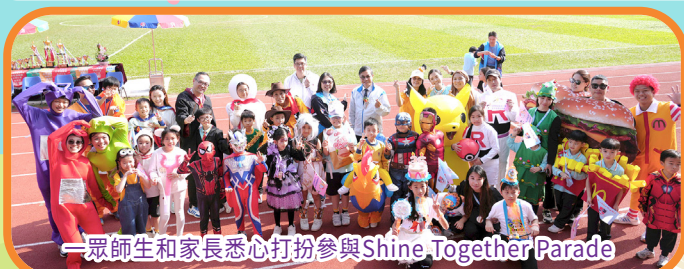
一眾師生和家長悉心打扮參與Shine Together Parade