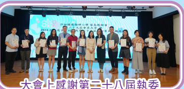
大會上感謝第三十八屆執委一年來的辛勞