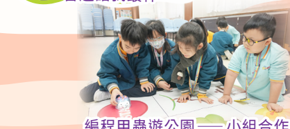
編程甲蟲遊公園——小組合作