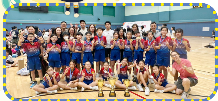
全港學界跳繩比賽2025