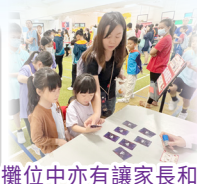
攤位中亦有讓家長和學生放鬆心情，培養正向價值觀的活動