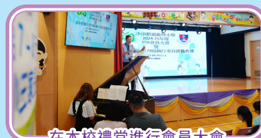
在本校禮堂進行會員大會