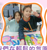
我們在輕鬆的氛圍畫圖圈畫啊！