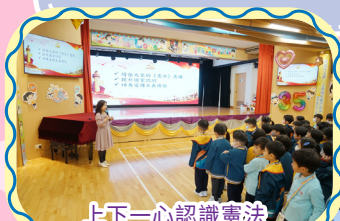
上下一心認識憲法

本校致力推行國家安全教育，培養學生國家觀念。我們的活動多元化，包括訓練學生進行「國旗下的講話」、介紹祖國的最新發展、全校宣傳「國家憲法日」及「國家安全教育日」等，藉此提升學生國民身份認同感。