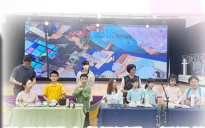
沙馬活動中孝親活動，透過茶道分享讓小朋友學會孝敬長輩