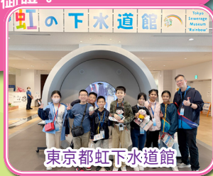
東京都虹下水道館