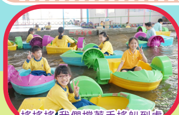
搖搖搖，我們撐著手搖船到處去！

三十五周年校慶田徑運動會已於2024年12月6日在沙田運動場舉行，健兒們在運動場上發揮拼搏精神，全力以赴爭取佳績，一同享受運動的樂趣。今年更設有啦啦隊比賽及Shine Together Parade，校長、老師、學生和家長們悉心打扮，共同創造一個難忘的運動會。