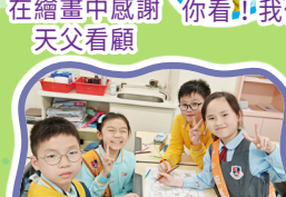
齊來創作福音棋盤