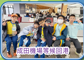
成田機場等候回港