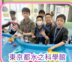
東京都水の科學館