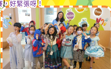
故事人物角色扮演