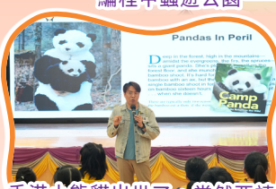
香港小熊猫出世了，當然要請嘉賓深入講解下啦！

學校積極推動閱讀風氣，除定期舉辦多元閱讀活動外，更配合4月23日「世界閱讀日」，與中文、英文、數學三科共同籌辦跨學科主題閱讀活動。