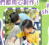
四年級同學為六年級學兄學姐搜集區內花葉製作乾花書籤