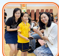
小朋友以敬茶表示孝敬長輩的心意