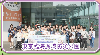
東京臨海廣域防災公園