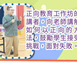
正向教育工作坊的講者，向老師講解如何以正向的方法，鼓勵學生接受挑戰，面對失敗。