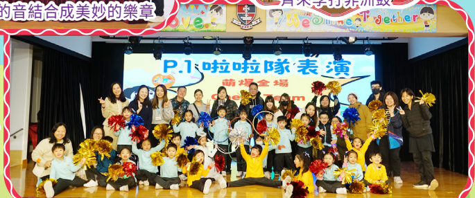
小一啦啦隊落地為大大家氣表演