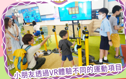
小朋友透過VR體驗不同的運動項目