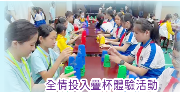
全情投入疊杯體驗活動

2025年6月26-27日，本校40位五年級學生及7位帶隊老師乘坐高鐵，出發到廣州進行姊妹交流活動。一連兩天的行程，學生透過參觀廣東科學中心、廣州亞運會亞殘運會博物館及沙面歐式建築群等，了解中國體育運動的發展及中國歐式建築物的源起；當中，我們會到訪石井張村中心小學，進行國內與本校師生交流，包括：花式跳繩表演、思源文化語言藝術表演、疊杯及剪紙體驗活動。完成交流後，同學們獲益良多，一起分享學習成果。