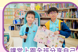
課堂上跟全班分享自己喜愛的圖書，真開心！

新落成的「Learning Galaxy」，寓意學生在知識的銀河中不斷尋找、探索，最後透過聖經的真理啟迪心智。學校致力打造豐富的閱讀環境，透過多元化的閱讀活動，讓學生在書海中開拓視野，在閱讀中發現自我，連結世界。