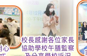
校長感謝各位家長協助學校午膳監察及分享學校近況