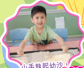
小手執起幼沙， 初嘗沙畫體驗。