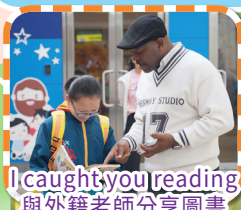
I caught you reading 與外籍老師分享圖書