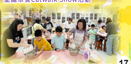
家長與小朋友一起齊心協力做蛋糕