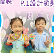
We love We shine together