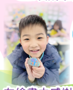
在繪畫中感謝天父看顧