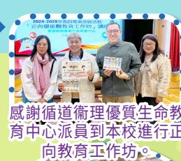
感謝循道衛理優質生命教育中心派員到本校進行正向教育工作坊。