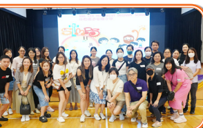
午膳家長義工隊合照