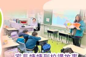
家長姨姨到校講故事