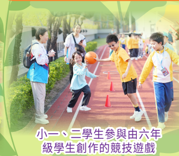
小一、二學生參與由六年級學生創作的競技遊戲