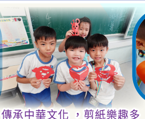
傳承中華文化，剪紙樂趣多