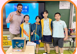
Planet Earth project presentation

此外，學校設有English Speaking Day、Movie Friday及普通話日，課前課餘透過趣味活動，營造豐富的語言學習環境。