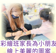
彩繪班家長為小朋友繪上美麗的圖案