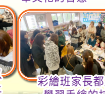
彩繪班家長都用心學習手繪的技巧