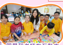
同學和老師在互動中欣賞彼此的創意。