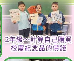
2年級~計算自己購買校慶紀念品的價錢