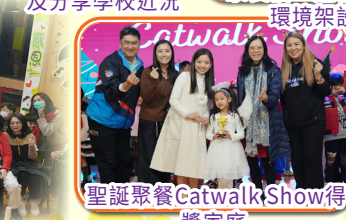
聖誕聚餐Catwalk Show得獎家庭