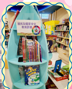
學生隨時隨地借閱 國民教育圖書