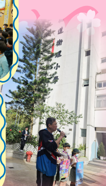
全校師生和家長齊認識 國家安全教育日