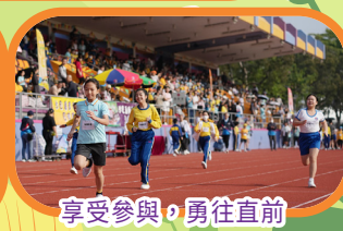
享受參與，勇往直前