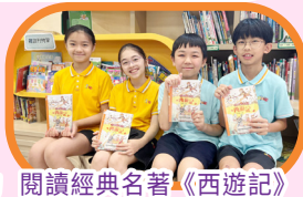
閱讀經典名著《西遊記》