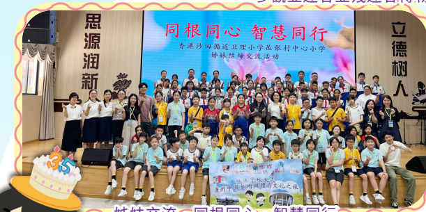
姊妹交流·同根同心·智慧同行