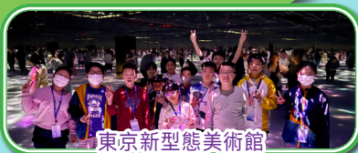
東京新型態美術館