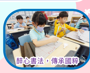
醉心書法，傳承國粹