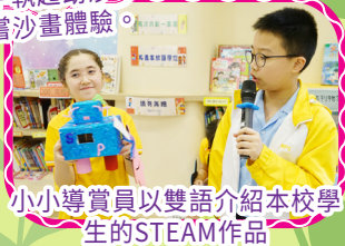
小小導賞員以雙語介紹本校學生的STEAM作品