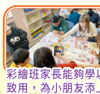
彩繪班家長能夠學以致用，為小朋友添上喜樂的色彩