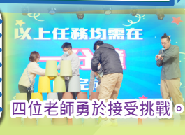
四位老師勇於接受挑戰。