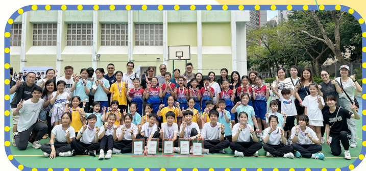
Jumper contest 2025