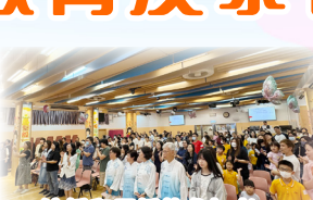
沙循和馬循的參加者一同高歌，場面熱鬧