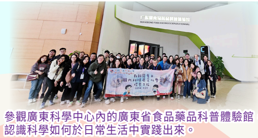
參觀廣東科學中心內的廣東省食品藥品科普體驗館，認識科學如何於日常生活中實踐出來。