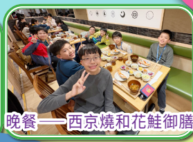
晚餐——西京燒和花鮭御膳