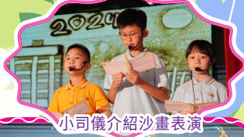
小司儀介紹沙畫表演