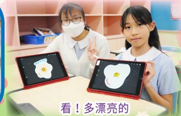
看！多漂亮的 Fun English Mosaic