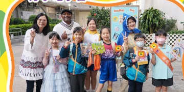
世界閱讀日活動好豐富啊！十分期待。