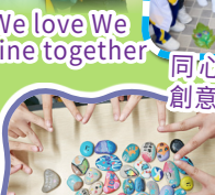
信心的石頭可以戰勝心中的巨人