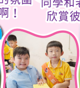
剪剪併併，自製玩具多有趣