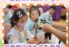
同學們試操作皮影戲偶，真的不容易啊！