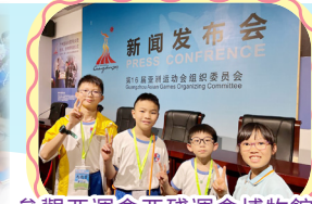
參觀亞運會亞殘運會博物館