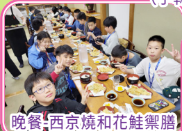
晚餐——西京燒和花鮭御膳