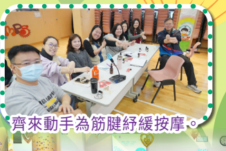
齊來動手為筋腱舒緩按摩。