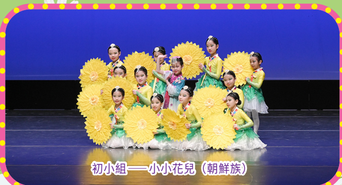
初小組——小小花兒 (朝鮮族)

2025年度「第六屆港澳大灣區青少年藝術展演」中初小組取得銀獎，高小組取得金獎的好成績。