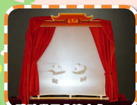
體驗世界非遺文化——皮影戲活動