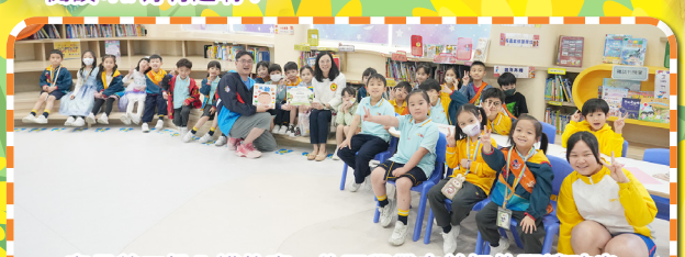
家長義工投入講故事，為同學帶來美好的閱讀時光