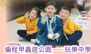
編程甲蟲遊公園——玩樂中學習