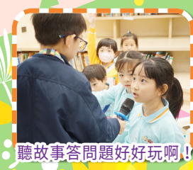
聽故事答問題好好玩啊！