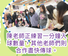
陳老師正練習一分鐘入球數量，其他老師們則合作盡快傳球。