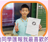
向同學匯報我最喜歡的中國菜，真開心！