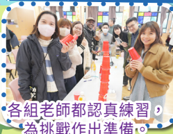
各組老師都認真練習，為挑戰作出準備。