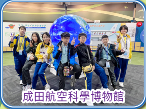
成田航空科學博物館