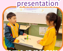
練習有禮貌地對答