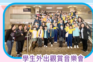
學生外出觀賞音樂會