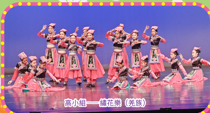
高小組——繡花樂 (羌族)