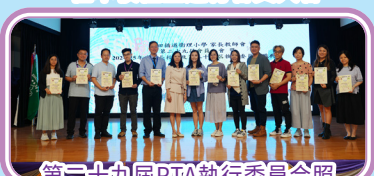
第三十九屆PTA執行委員合照