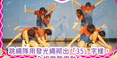
跳繩隊用發光繩砌出「35」字樣， 全場掌聲雷動。