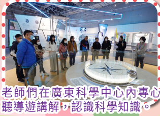
老師們在廣東科學中心內專心聽導遊講解，認識科學知識。