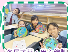
各展才華，用心繪製