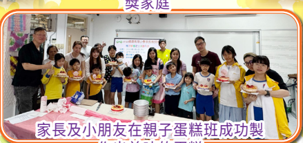
家長及小朋友在親子蛋糕班成功製作出美味的蛋糕