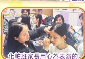
化粧班家長用心為表演的小朋友化粧