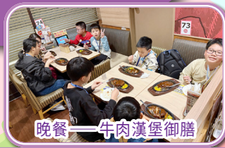
晚餐——牛肉漢堡御膳