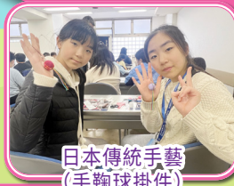
日本傳統手藝 (手鞠球掛件)

上午去了東京都虹下水道館，認識日本下水道系統如何維持東京的公共衛生。再到東京都水の科學館，透過親自觸摸及參觀展品，將水以各種有趣的方式呈現，讓同學一邊玩樂一邊學習。午餐吃了豐富的海鮮力士鍋。然後前往參加日本傳統手藝製作，製作出獨一無二的手鞠球掛飾。然後前往參觀日本科學未來館，觀賞球幕影院電影，認識先端科學技術。晚餐享用了天婦羅御膳。