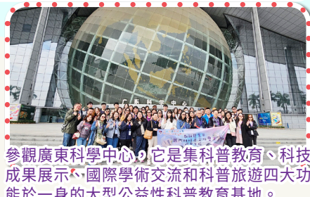
參觀廣東科學中心，它是集科普教育、科技成果展示、國際學術交流和科普旅遊四大功能於一身的大型公益性科普教育基地。