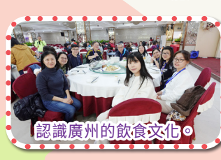
認識廣州的飲食文化。