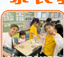
有不同攤位活動讓家長和學生體驗中華文化的智慧