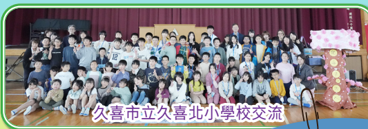
久喜市立久喜北小學校交流