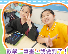
數學一筆畫，我做到了！