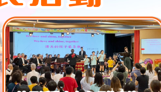
沙馬活動上有多項的表演，如中樂、中國舞及武術等，非常精彩