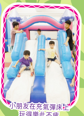
小朋友在充氣彈床止 玩得樂此不疲