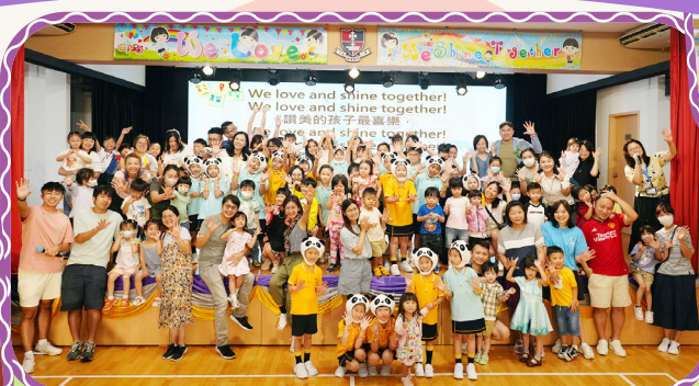
當日氣氛熱鬧，參與活動的家長和本校「小熊貓」一同大合照！