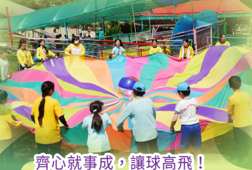
齊心就事成，讓球高飛！