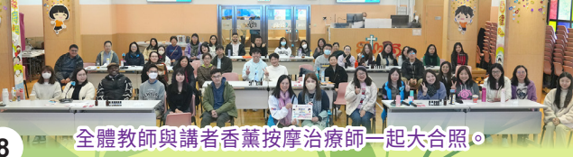
全體教師與講者香薰按摩治療師一起大合照。