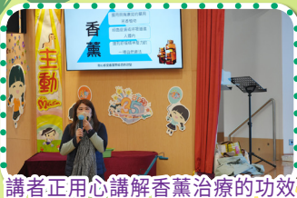
講者正用心講解香薰治療的功效。