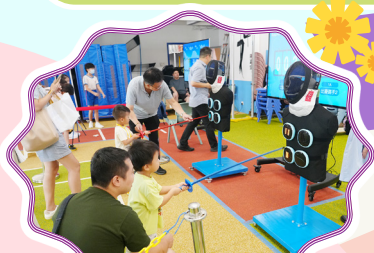
大家都化身成小小「劍手」