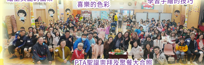
PTA聖誕崇拜及聚餐大合照