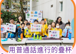
用普通話進行的疊杯遊戲，你想挑戰嗎