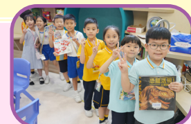
最開心就是可以在堂上借圖書！