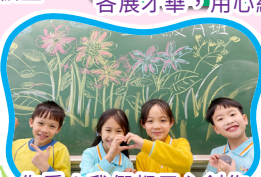
你看！我們都用心創作！