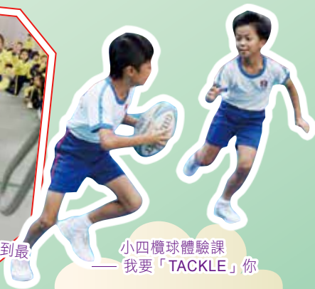
小四攔球體驗課——我要「TACKLE」你