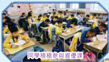
同學積極參與資優課