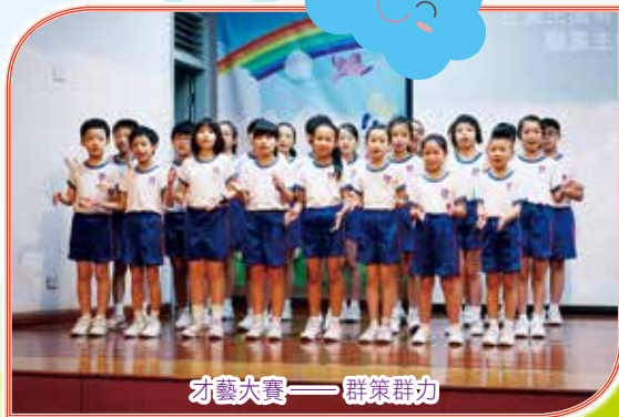
才藝大賽——群策群力