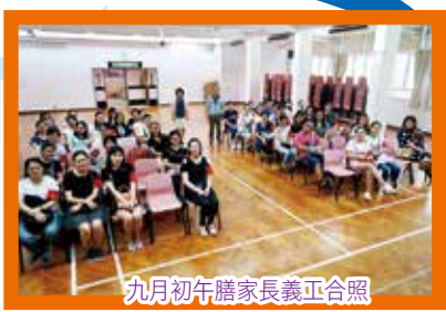
九月初午膳家長義工合照