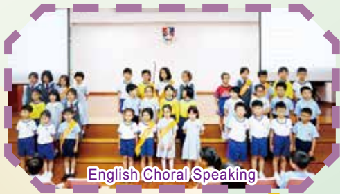
English Choral Speaking