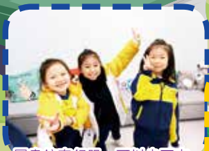
圖書館真舒服,可以坐下來慢慢地看書