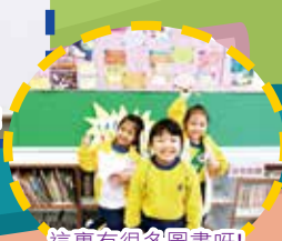
這裏有很多圖書呀!