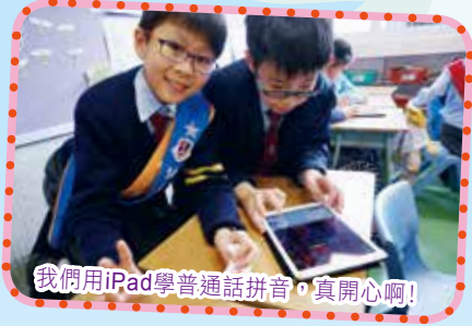
我們用iPad學普通話拼音，真開心啊！