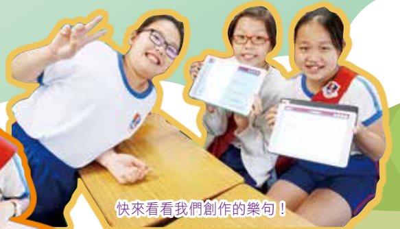
快來看看我們創作的樂句！