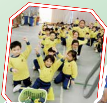
小二競技遊戲-YEAH!我們拿到最多的球,我們取得冠軍!