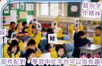
部件配對，學習中文字也可以很有趣呢！