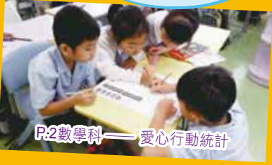
P.2數學科——愛心行動統計