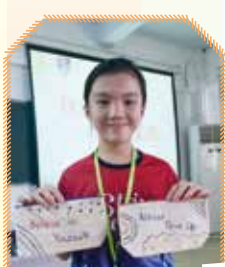
卓穎親手製作的精心禮物送給內地學生