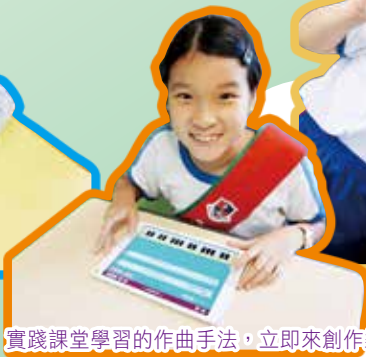
實踐課堂學習的作曲手法，立即來創作樂句！