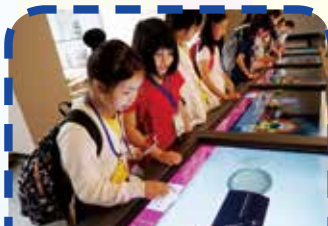
在粵劇藝術博物館內的展區，學生全神貫注地玩互動遊戲！