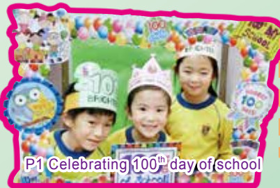
P1 Celebrating 100 th day of school