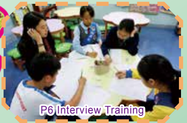
P6 Interview Training