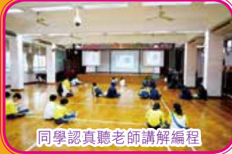
同學認真聽老師講解編程