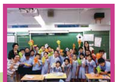
小朋友跟家長義工做手工十分投入和開心