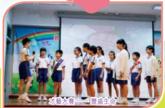
才藝大賽——豐盛生命