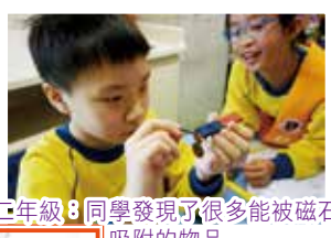
二年級:同學發現了很多能被磁石吸附的物品