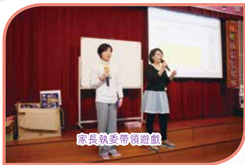
家長執委帶領遊戲