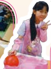
「耶穌大藝術家」 創作畫班