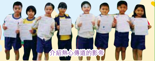
介紹熱心傳道的影帝