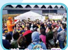
Volvo Ocean Race 學校導賞活動