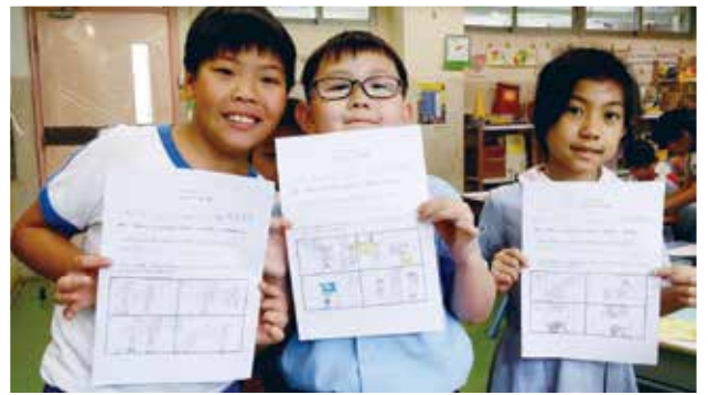
四格漫畫分享價值觀