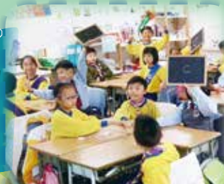
同學們正努力地搶答有關陶藝的問題