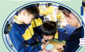
一年級:同學正測試不同材料的防滑程度