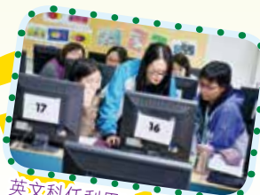
英文科任利用Nearpod設計學習活動