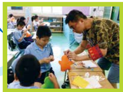
家長教小朋友做手工