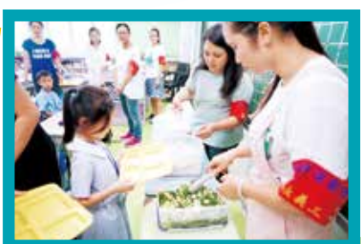
家長義工們在午膳時細心照顧小一新生