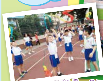
學生第一次參與課間操，還在玩絲帶操呢！

經過探訪及兩校商討交流安排後，於16-17及17-18年分別以「藝術文化交流」及「體育文化交流」為主題進行雙方交流，兩團共90人次參加。本校學生透過親身探訪姊妹學校，對內地的學習模式、中國特色及民間藝術都有了相當的了解。