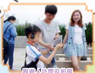
跟遊人訪問及拍照