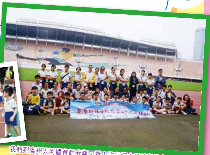
我們到廣州天河體育館參觀。看！這是恆大足球隊的主場呢！