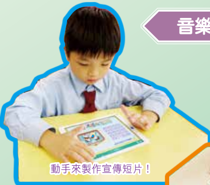
動手來製作宣傳短片！