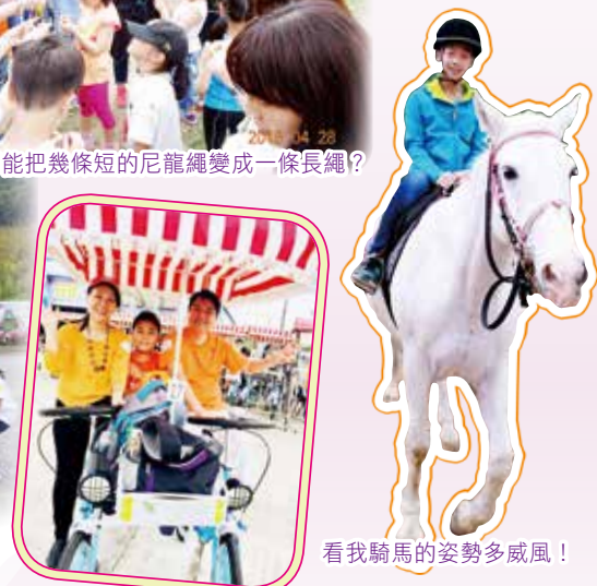
看我騎馬的姿勢多威風！