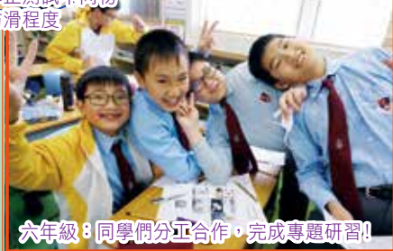
六年級:同學們分工合作,完成專題研習!