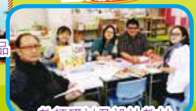
教師研討及設計教材