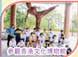
參觀香港文化博物館