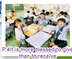
P.4It is more blessed to give than to receive