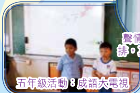
五年級活動：成語大電視