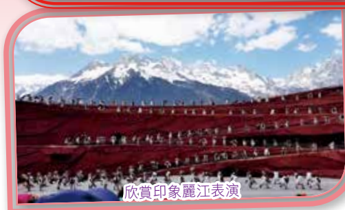
欣賞印象麗江表演