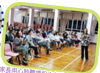
家長用心聆聽課程主任的分享