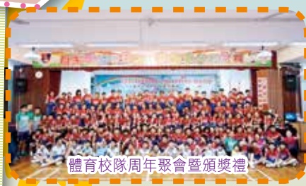
體育校隊周年聚會暨頒獎禮