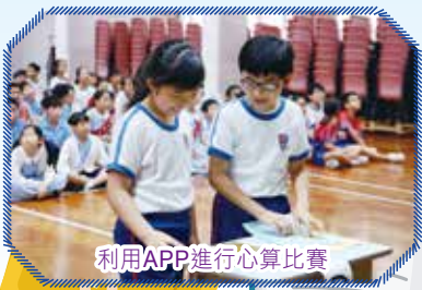
利用APP進行心算比賽