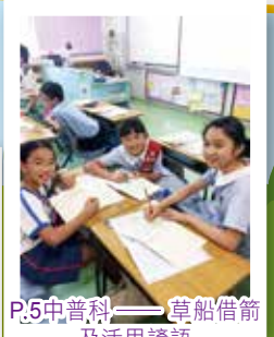
P.5中普科——草船借箭及活用諺語