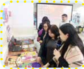
常識科任參觀友校STEM教室