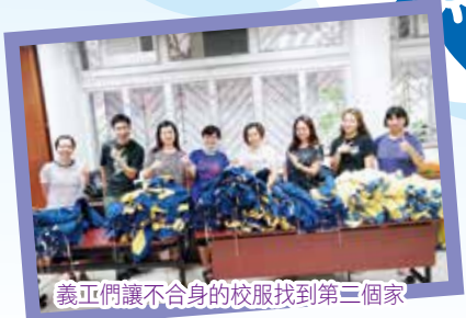
義工們讓不合身的校服找到第三個家