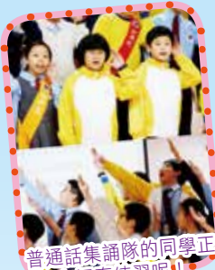
普通話集誦隊的同學正在認真練習呢！