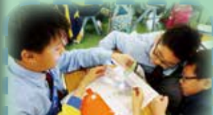
五年級:光的反射,很奇妙!