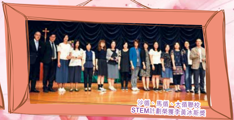
沙循、馬循、大循聯校 STEM計劃榮獲李黃冰斯獎