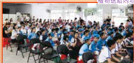
兩校的表演生都準備好了！你也想欣賞我們的表演嗎