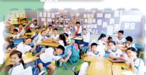
大家學得開心又投入視藝科活動