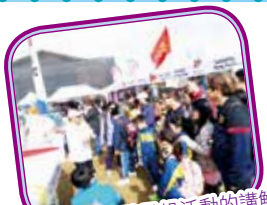
大家都很留心聽風帆活動的講解