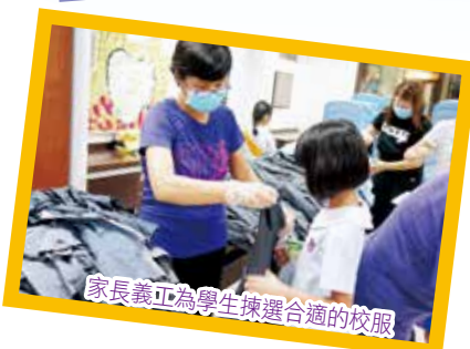
家長義工為學生揀選合適的校服