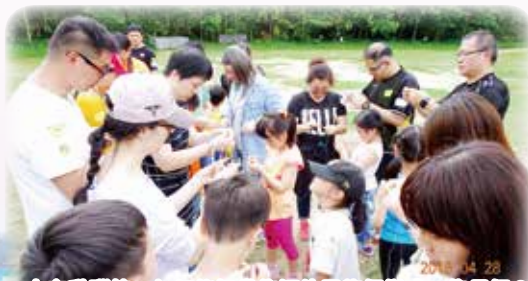
大家動腦筋，如何能把幾條短的尼龍繩變成一條長繩？