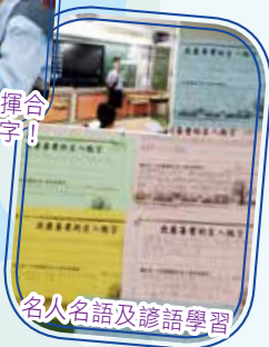
名人名語及諺語學習