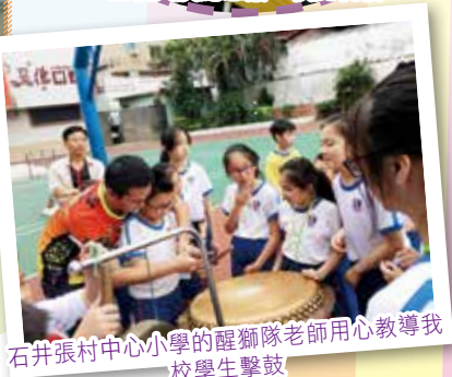
石井張村中心小學的醒獅隊老師用心教導我 校學生擊鼓