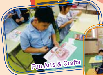
Fun Arts & Crafts