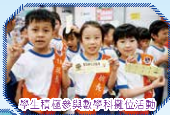
學生積極參與數學科攤位活動