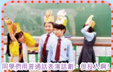
同學們用普通話表演話劇，很投入啊！