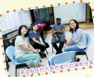
英文科任代入角色進行討論和分享