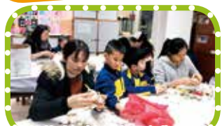
親子水仙花球切割班·家長和學生樂在其中