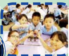
三年級:齊來學習使用溫度計做實驗!