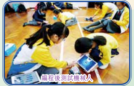
編程後測試機械人