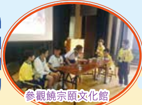
參觀饒宗頤文化館