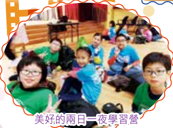
美好的兩日一夜學習營