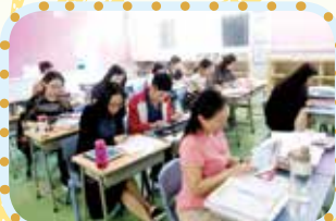
中文科任學習使用iPad程式教學