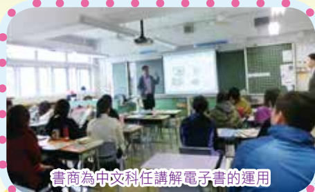
書商為中文科任講解電子書的運用