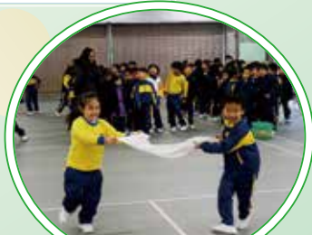
小一競技遊戲——你看我們多投入!