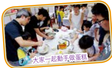
大家一起動手做蛋糕