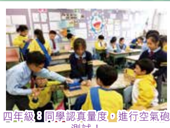
四年級:同學認真量度,進行空氣砲測試!