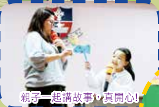
親子一起講故事,真開心!