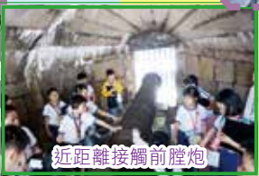
近距離接觸前膛炮