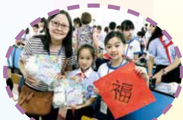
互相交換紀念品，彼此祝福