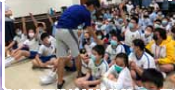
老師提問快速計算的技巧，同學勇於回答。