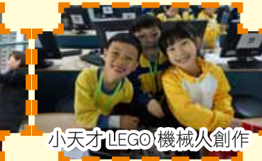
小天才LEGO機械人創作