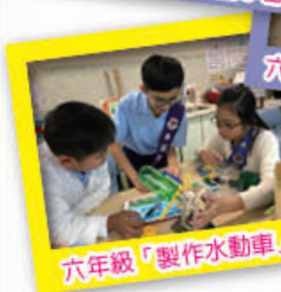
六年級「製作水動車」