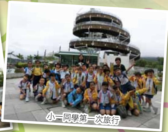
小一同學第一次旅行