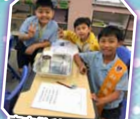
齊來做科學小實驗