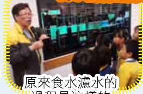
原來食水濾水的過程是這樣的