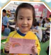
立願行動 與神立約天父上帝的愛