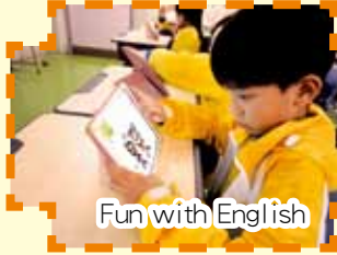
Fun with English