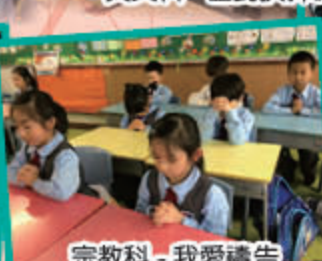
宗教科 - 我愛禱告