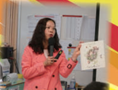
校長為家長開設繪本故事辦工作坊