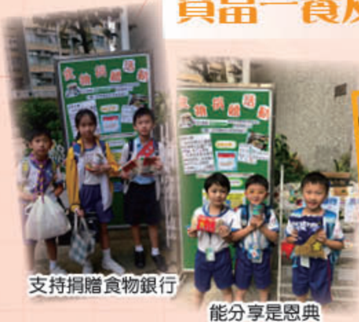
支持捐贈食物銀行