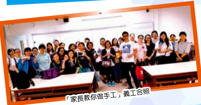
「家長教你做手工」義工合照