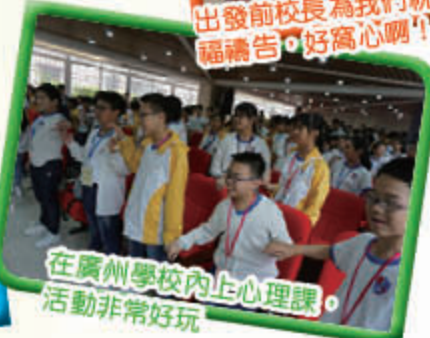
在廣州學校內上心理課，活動非常好玩