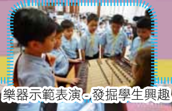
樂器示範表演，發掘學生興趣