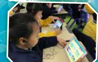
用 iPad 製作廣告宣傳短片，真有趣