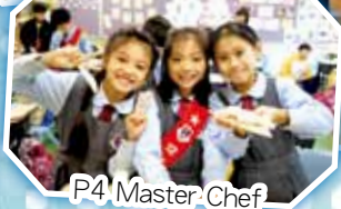
P4 Master Chef