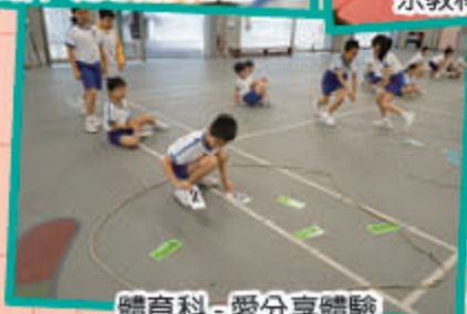
體育科 - 愛分享體驗