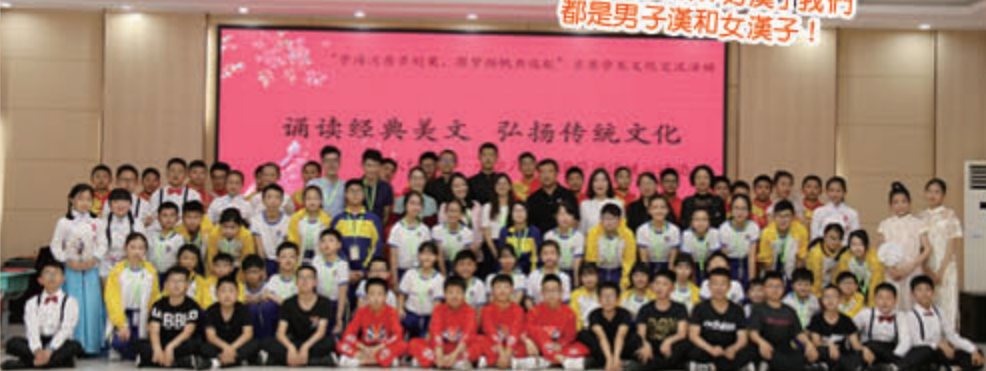
兩校師生文化交流