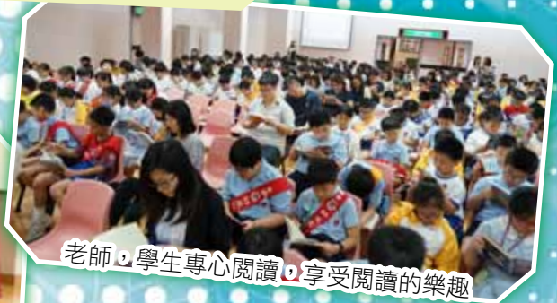
老師，學生專心閱讀，享受閱讀的樂趣