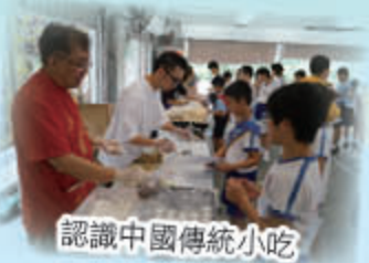
認識中國傳統小吃