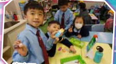
齊來玩 Osmo，過關真興奮。