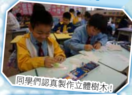
同學們認真製作立體樹木!