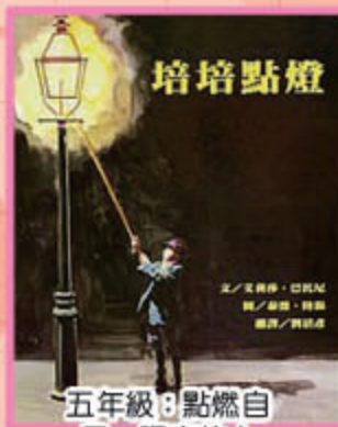
五年級：點燃自 己，照亮他人