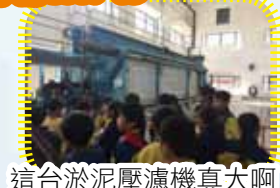
這台淤泥壓濾機真大啊!