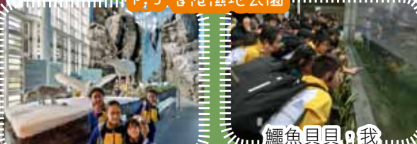
我們和珍貴的動物合照