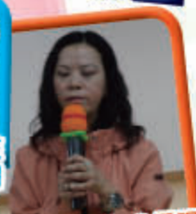
出發前校長為我們祝福禱告，好窩心喇！