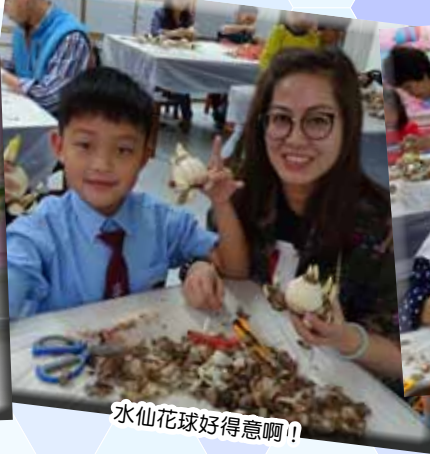
水仙花球好得意啊!!