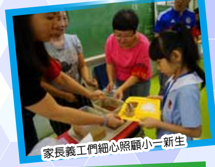
家長義工們細心照顧小一新生