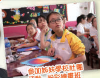
參加姊妹學校社團活動 - 粉彩繪畫班