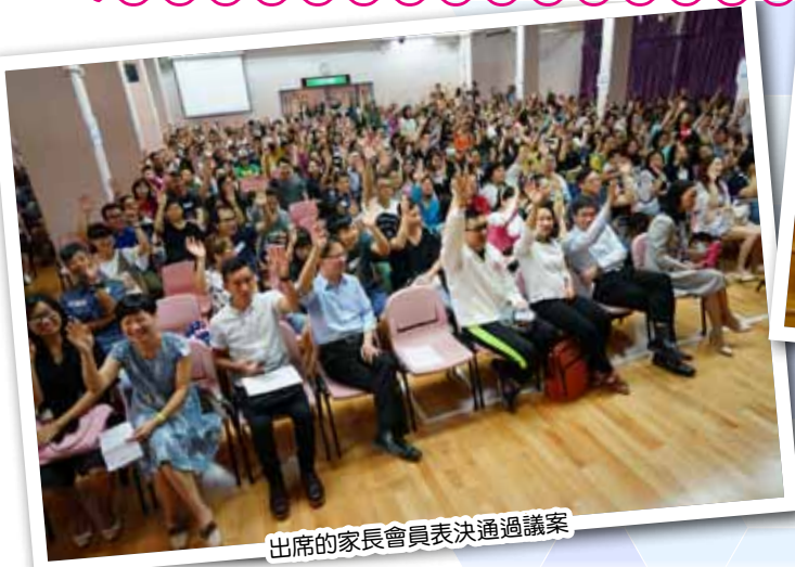
出席的家長會員表決通過議案