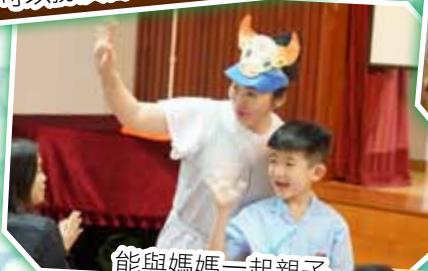
能與媽媽一起親子講故事，好開心呀!