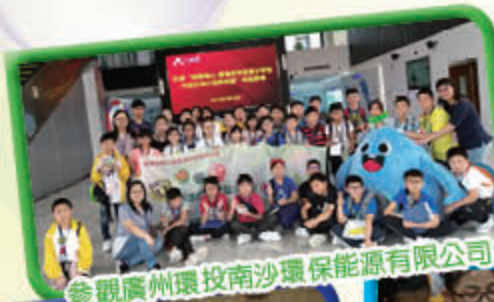
參觀廣州環投南沙環保能源有限公司