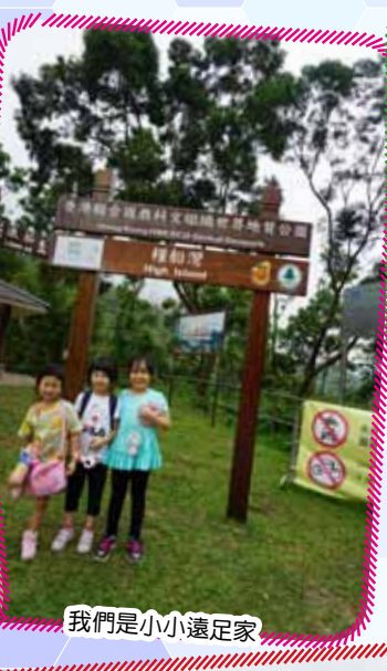
我們是小小遠足家