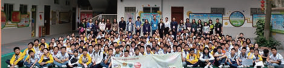
參觀廣州小北路小學大合照