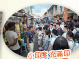
小印度 充滿印度特色的小區