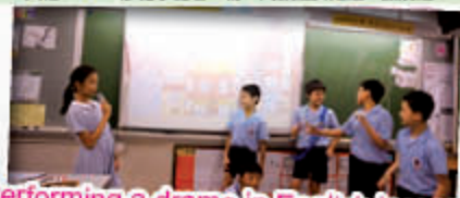
Performing a drama in English lesson