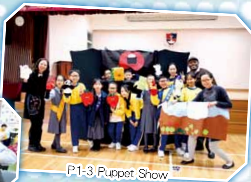
P1-3 Puppet Show