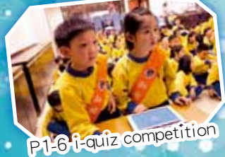
P1-6 i-quiz competition