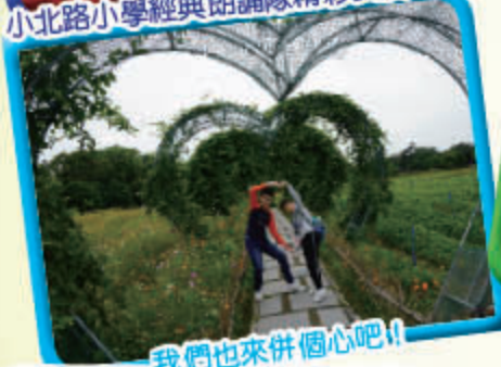
我們也來併個心吧！！