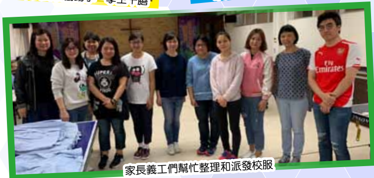
家長義工們幫忙整理和派發校服