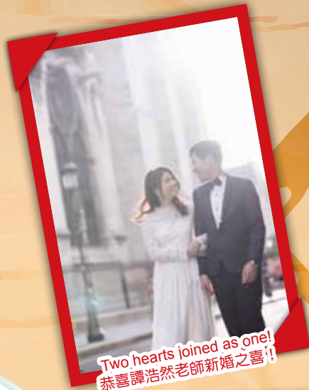
Two hearts joined as one! 恭喜譚浩然老師新婚之喜!!