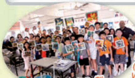
BATIK WORKSHOP 製作蠟畫，認識馬來西亞人的染布文化。

本校積極推動全方位學習模式，讓學生跨越地域的限制，跳出課室，通過不同途徑的體驗和學習活動，從而作深入的探索和經歷。本校於六月舉行了五天的海外考察交流活動，帶領學生到新加坡，親身體驗當地的科學和科技發展的情況，同時感受不同的文化和風俗。