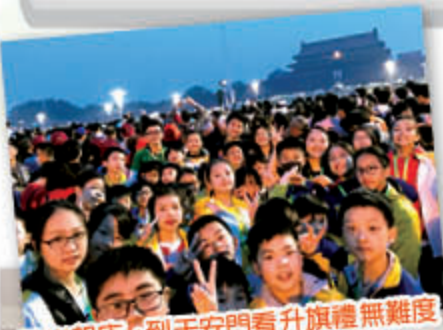
3 點半起床，到天安門看升旗禮無難度！