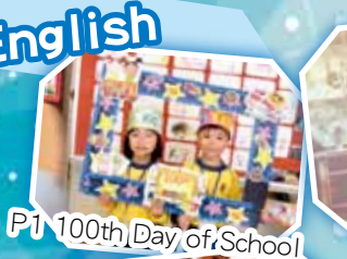
P1 100th Day of School