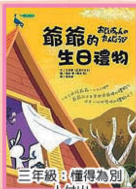
三年級：懂得為別 人付出