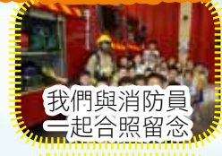
我們與消防員一起合照留念