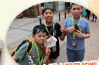
牛車水 中國人聚居的地方，參觀華人的店舖。