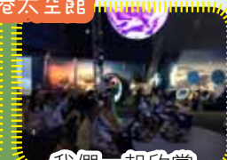
我們一起欣賞宇宙大爆炸論