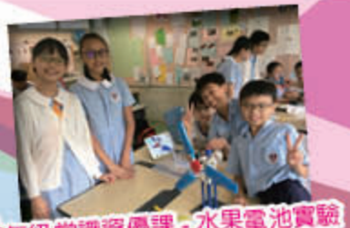
五年級常識資優課 - 水果電池實驗