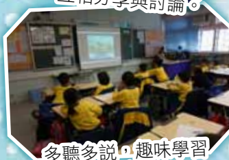
多聽多說，趣味學習普通話!