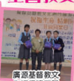
廣源基督教文化週得獎同學 (高級組)