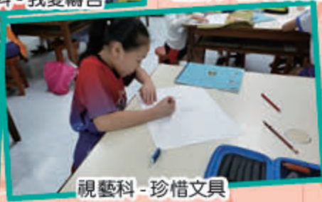
視藝科 - 珍惜文具