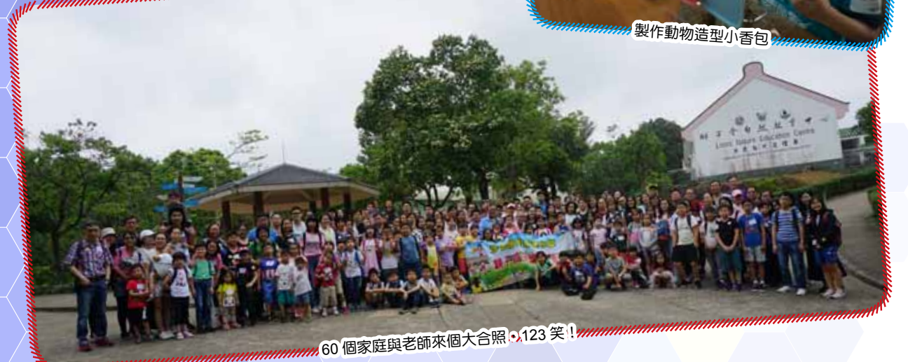
60 個家庭與老師來個大合照，123 笑！