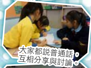
大家都說普通話，互相分享與討論