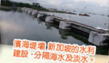
濱海堤壩 新加坡的水利建設，分隔海水及淡水。