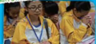
祈求天父保守我們兩天交流平安「食得招積、關得舒適」……