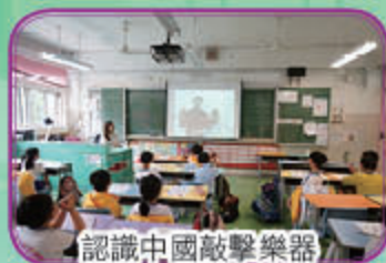
認識中國敲擊樂器