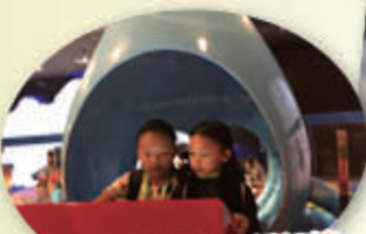
新生水世界 認識新加坡濾水技術及新生水製作。