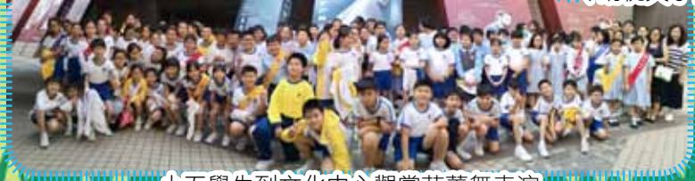
小五學生到文化中心觀賞芭蕾舞表演