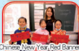
Chinese New Year Red Banners