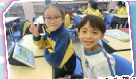
用 Scratch 製作故事，生動有趣。