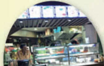
老巴剎市場 同學在市場內自由選購食物，感受當地飲食文化