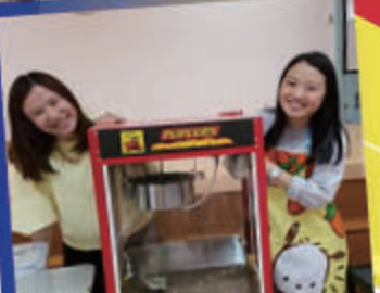
爆谷已經派晒啦！下次再來！