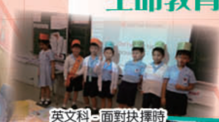
英文科 - 面對抉擇時