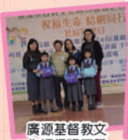
廣源基督教文化週得獎同學 (初級組)