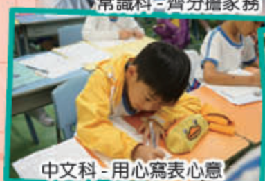
中文科 - 用心寫表心意