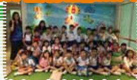
大家一起和益力多合照