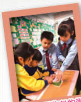
一年級「不同物料的測試」