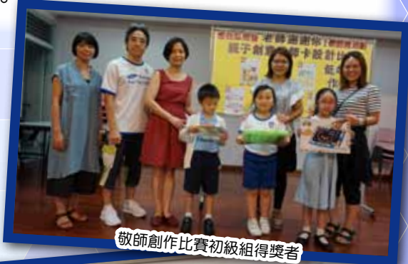
敬師創作比賽初級組得獎者