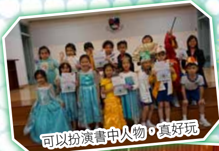
可以扮演書中人物，真好玩