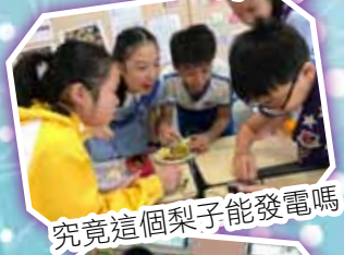
究竟這個梨子能發電嗎