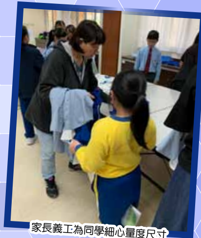
家長義工為同學細心量度尺寸