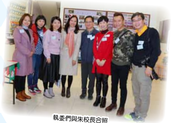
執委們與朱校長合照