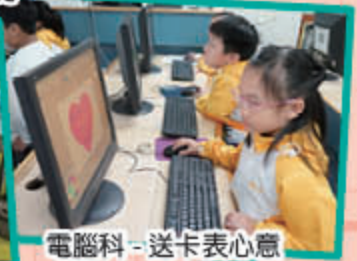
電腦科 - 送卡表心意