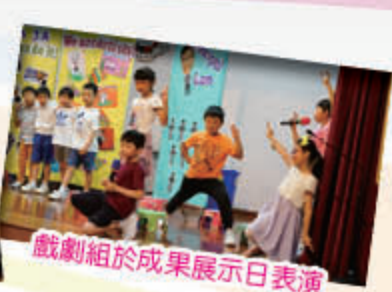
戲劇組於成果展示日表演