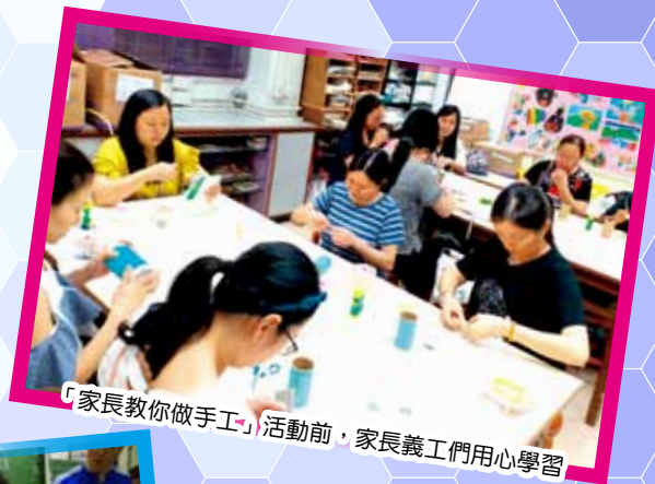
「家長教你做手工」活動前・家長義工們用心學習