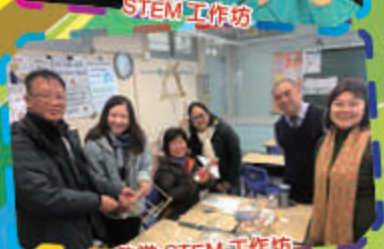
數常 STEM 工作坊