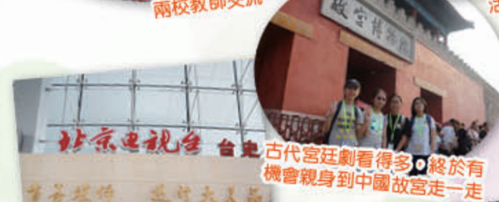
古代宮廷劇看得多，終於有機會親身到中國故宮走一走