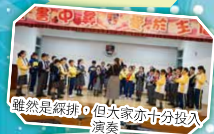
雖然是綵排，但大家亦十分投入演奏