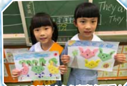
看看我們的小兔兔寶寶多可愛!