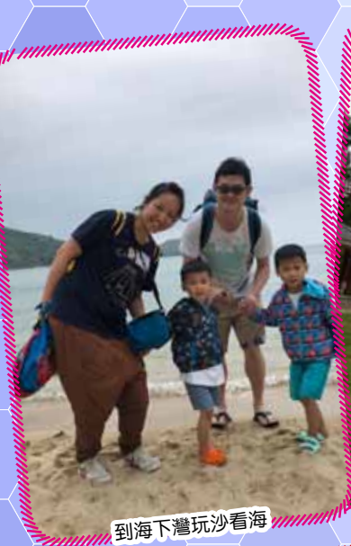
到海下灣玩沙看海