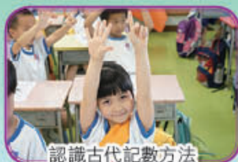
認識古代記數方法