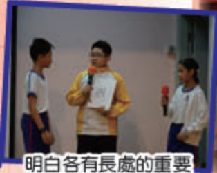
明白各有長處的重要