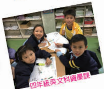
四年級英文科資優課