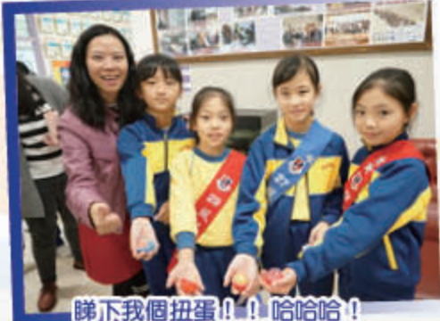
睇吓我個扭蛋！！哈哈！