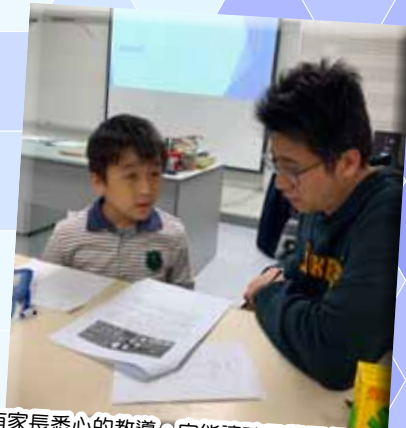
有家長悉心的教導・定能讓孩子學習得更好!