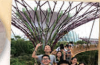
濱海灣花園 (OCBC 空中步道) (FLOWER DOME) (CLOUD FOREST) 認識這裏的雨水收集系統。行上高空走道，欣賞濱海灣花園的風景。