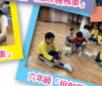
六年級「投射器測壘」