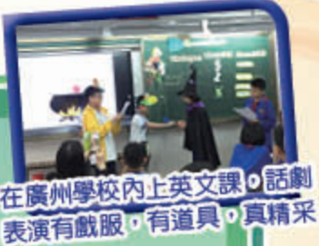
在廣州學校內上英文課。話劇表演有戲服，有道具，真精采

學生除學到環保知識，特別享受與內地同學一起上活動課，大家一同欣賞表演及上課等寶貴的體驗實是難得。此外，導遊的沿途講解亦能豐富學生對國內民生和歷史等認識，有助提升國民身份認同。