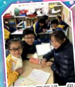
三個臭皮匠勝過一個諸葛亮!