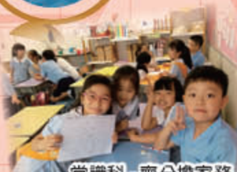
常識科 - 齊分擔家務