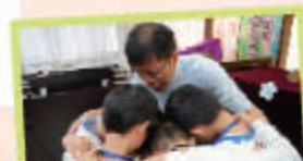
男孩子逐一接受岑牧師祝福