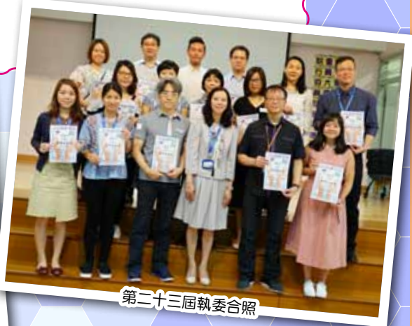
第二十三屆執委合照