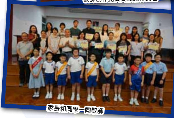
家長和同學一同敬師