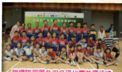
跳繩隊同學參與多項比賽並獲佳績