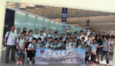
我們由香港機場出發去新加坡了