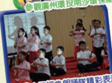
小北路小學經典朗誦隊精彩表演