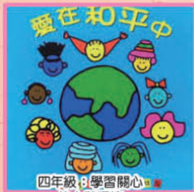
四年級：學習關心 他人與環境