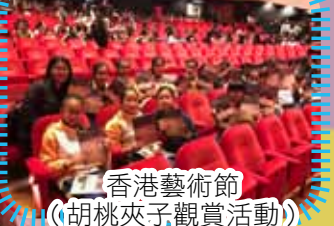
香港藝術節 (胡桃夾子觀賞活動)