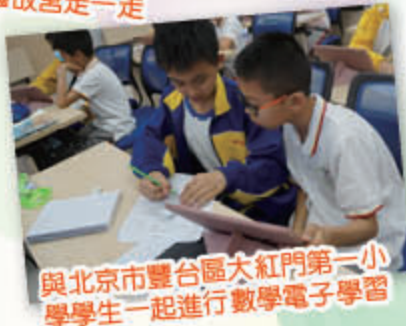
與北京市豐台區大紅門第一小學學生一起進行數學電子學習