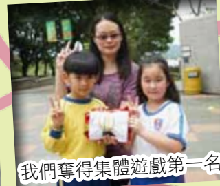
我們奪得集體遊戲第一名