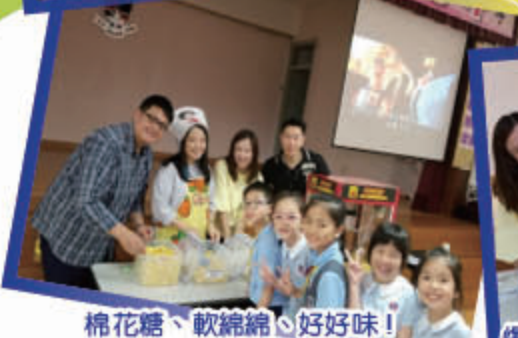
棉花糖、軟綿綿、好好味！