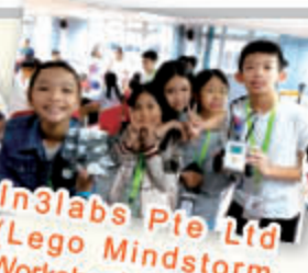
In3labs Pte Ltd (Lego Mindstorm Workshop) 學習製作 Lego 機械人，小組製作後進行比賽。