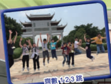
齊數 123 跳