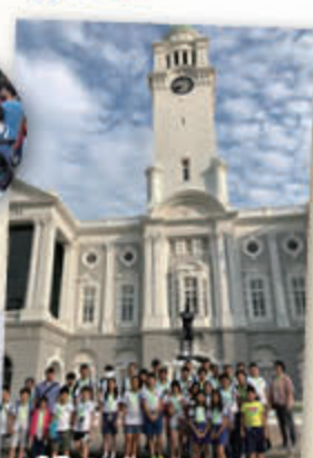
Victoria Theatre 新加坡的歷史建築