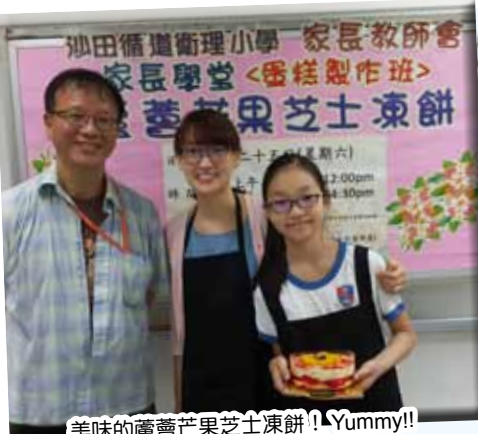
美味的蘆薈芒果芝士凍餅!! Yummy!!