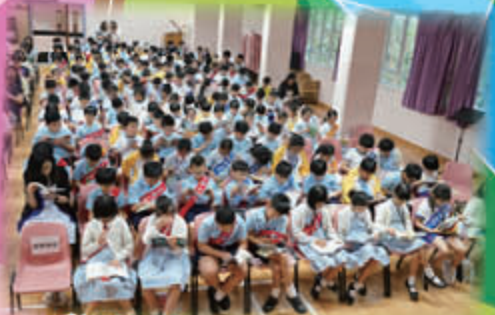
老師學生們一起投入閱讀世界