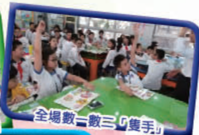
全場數一數三「隻手」