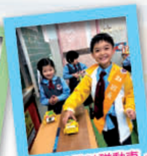
三年級「設計磁動車」