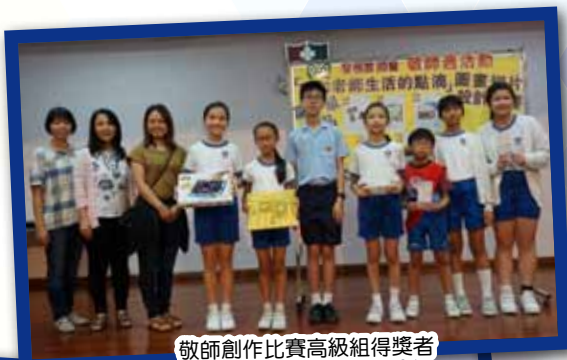
敬師創作比賽高級組得獎者

敬師週午會分高低年級兩場，分別在2018年5月15日及5月17日舉行，每場都有三十多位家長出席。程序有會長及執委致詞，頒發敬師活動得獎學生獎品，以及向老師們致送小型風扇、感謝狀及敬師卡，場面溫馨感人。家長的愛心行動，成為學生的好榜樣，懂得尊師敬師、懷著感恩的心。