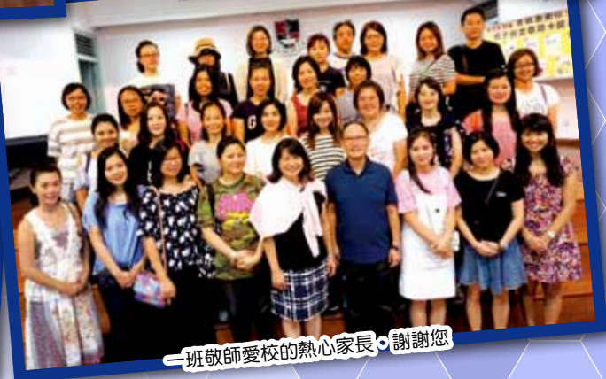
一班敬師愛校的熱心家長，謝謝您