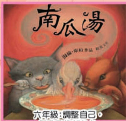
六年級：調整自己， 勇敢承擔新角色