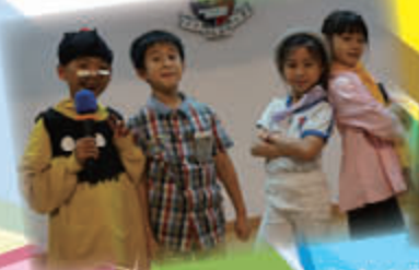
書中人物扮演比賽