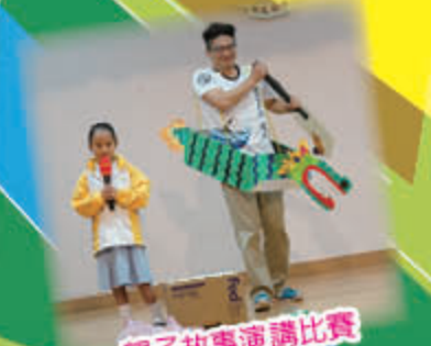
親子故事演講比賽