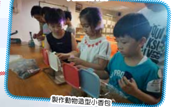
製作動物造型小香包