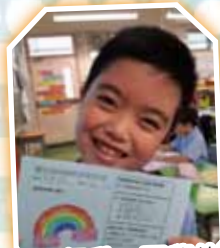
立願行動 同學的笑臉也是一道美麗的彩虹