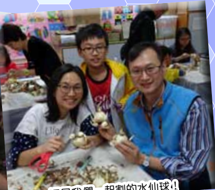
這是我們一起割的水仙球!!