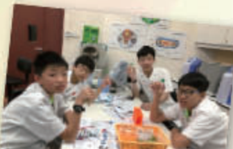
科學館 DNA WORKSHOP 透過實驗抽取 DNA，認識 DNA 及製作 DNA 模型。