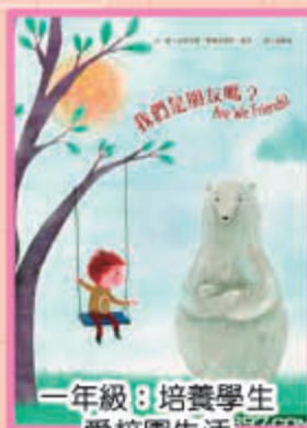
一年級：培養學生 愛校園生活