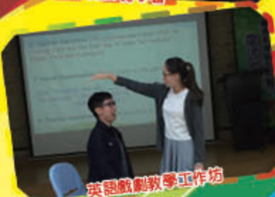
英語戲劇教學工作坊