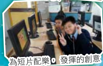
為短片配樂，發揮的創意