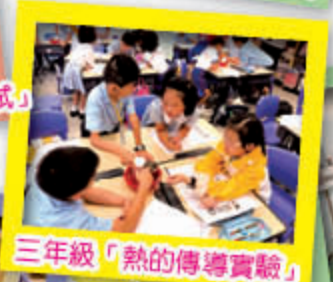
三年級「熱的傳導實驗」