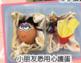
小朋友悉用心護蛋