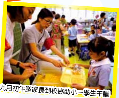
九月初午膳家長到校協助小一學生午膳