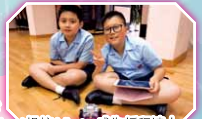
Ipad 操控 Mbot，成為編程達人。