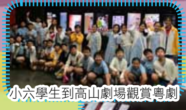
小六學生到高山劇場觀賞粵劇