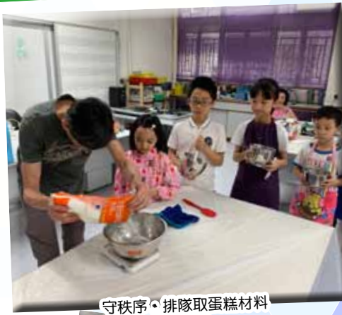
守秩序・排隊取蛋糕材料