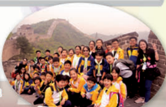
「不到長城非好漢」我們都是男子漢和女漢子！