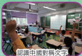
認識中國對稱文字